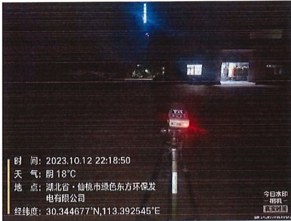
厂界 1# (▲1) 噪声监测点位