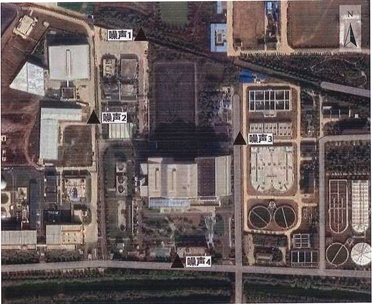
图例： ▲噪声监测点位