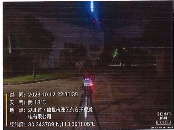
厂界 2# (▲2) 噪声监测点位