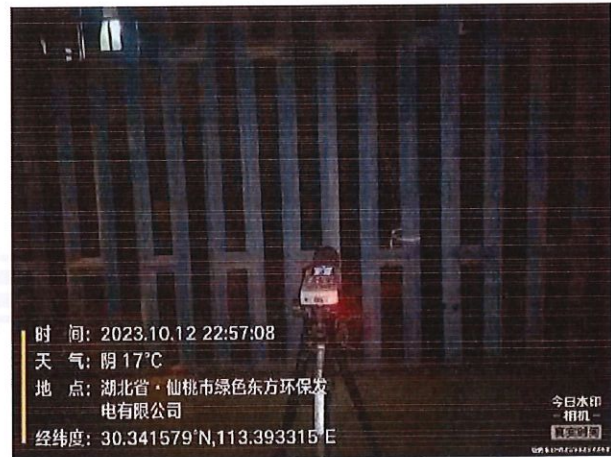
厂界 4# (▲4) 噪声监测点位